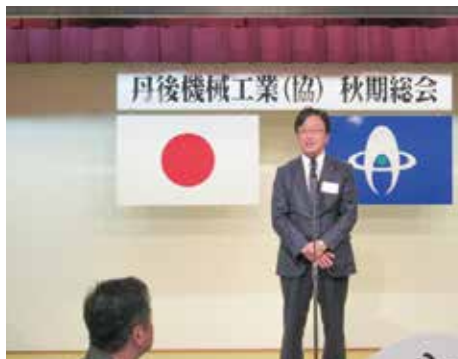
平井公彦丹後広域振興局長